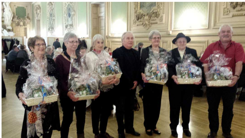
Quelques heureux gagnants de notre tombola